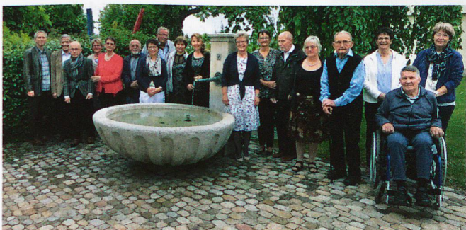
Oben: Turnen in Tschugg. Unten: Gruppenfoto.