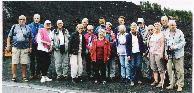
Oben links: Im «Ohr des Dionysios» in Syrakus. Oben rechts: Wanderung im Naturpark. Unten: Gruppenfoto.