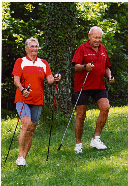
Il Nordic Walking ha degli effetti benefici per i parkinsoniani.

Il corso di Nordic Walking, organizzato in 10 incontri, che partirà ad aprile, è pensato per tutti i Parkinsoniani e loro congiunti che amano camminare.