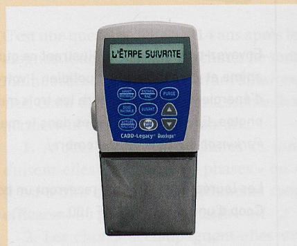
Pompe à Duodopa® : administration du médicament dans l'intestin