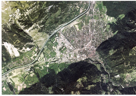
Chur, Luftbild Chur, aerial photograph