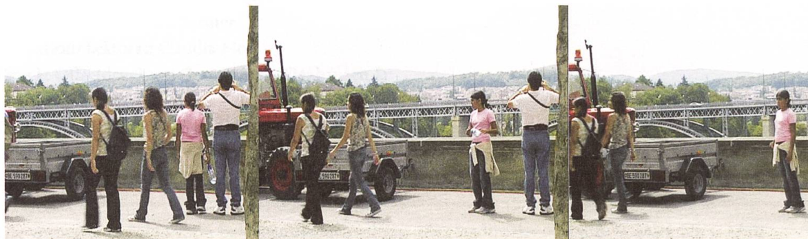
Turbinenplatz Zürich, Stadtpark St.Gallen, Münsterterrasse Bern. Videostills 2004