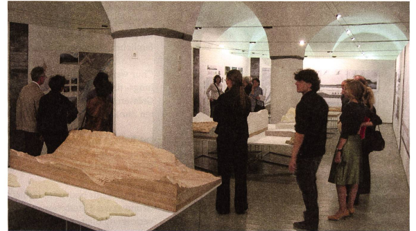
Ausstellung der Studentenarbeiten in der Stadtgalerie Chur, September 2005.

des Rossbodens, folglich sind ihre Schwerpunkte und Themen an unterschiedlichen Orten innerhalb des Geländes angesetzt. Sie sind nicht als in sich geschlossene Projekte zu verstehen, sondern viel mehr als sich stetig weiterentwickelnde und verändernde landschaftsarchitektonische Entwürfe, die alle auf ihre eigene Weise der Stadt Chur eine neue landschaftliche Identität verleihen.