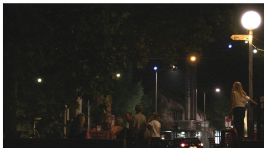
Videostills aus Studentenarbeiten; alle Videos auf: www.landscape-pamphlet.net