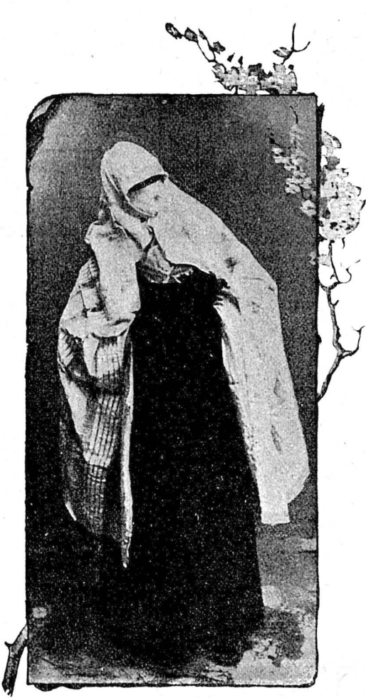
Femme turque de Sarajewo.