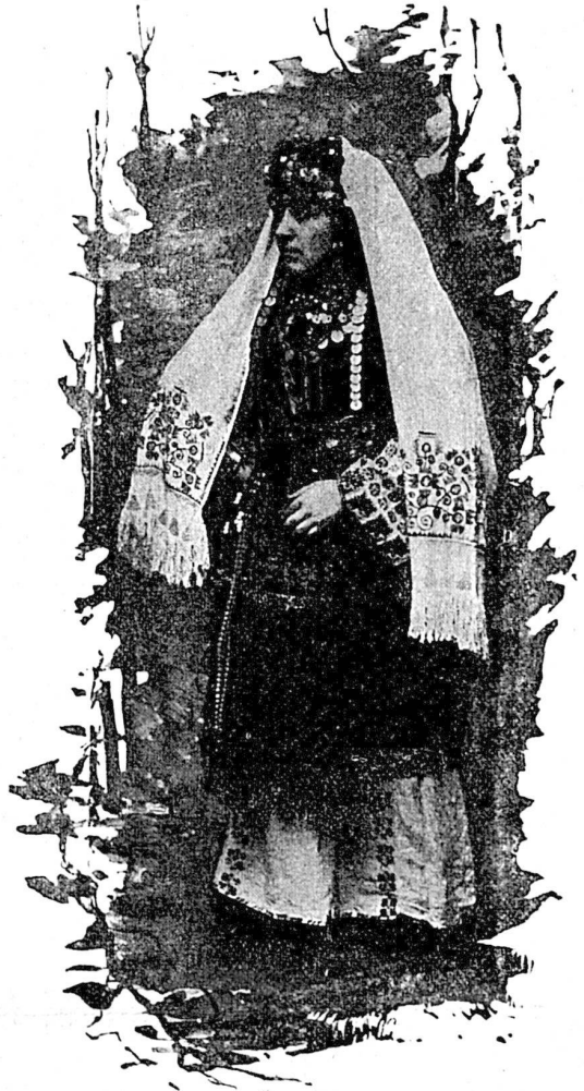
Jeune fille de Sarajewo.

Sarajewo , la capitale de la Bosnie, est une des plus belles villes turques, et elle s'appuie aux flancs d'une fertile montagne.