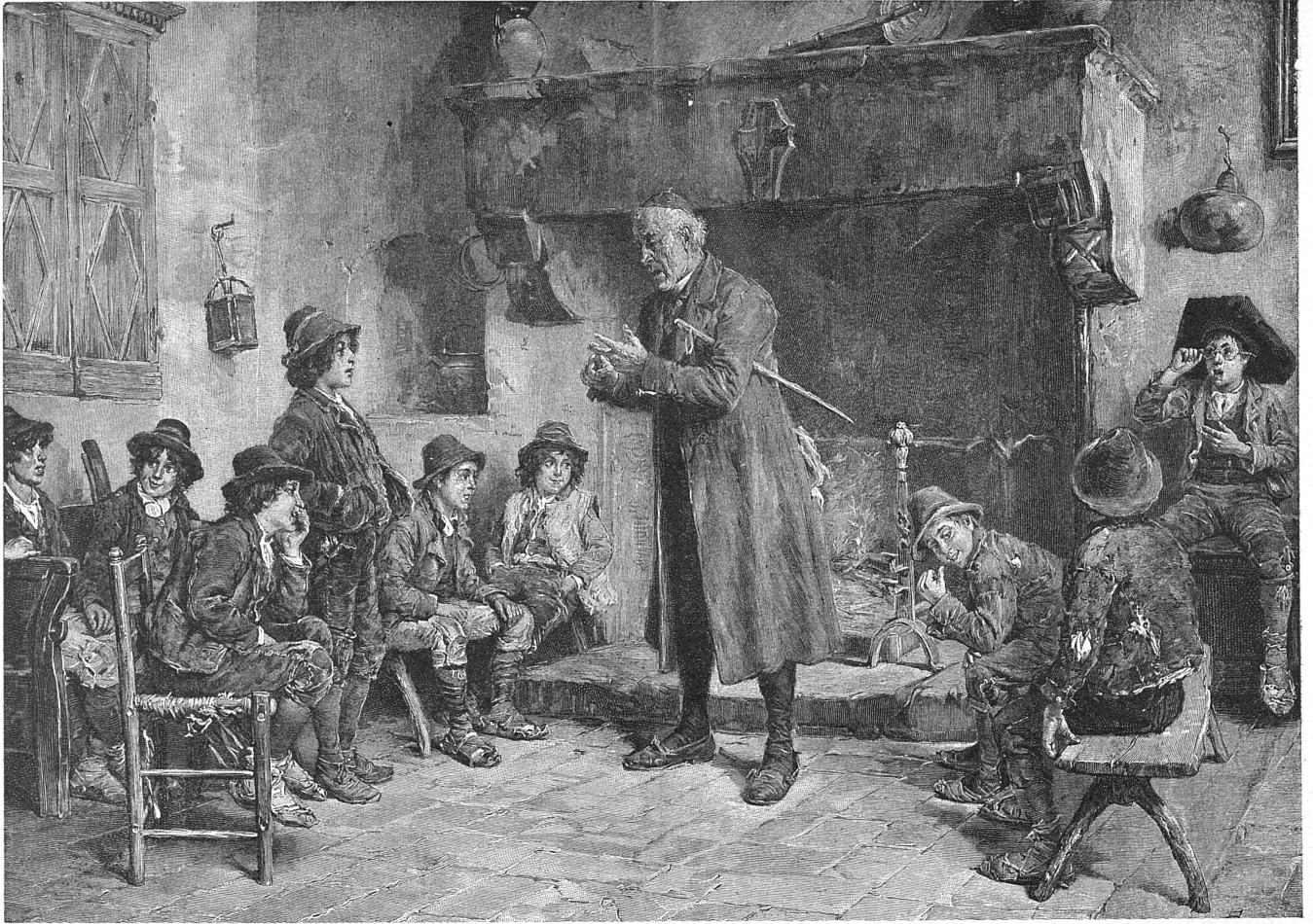
Une Ecole Italienne (Tableau de F. Berganini)