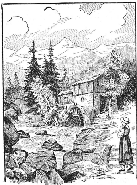
Où est le meunier ?