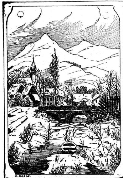
Où est le batelier ?