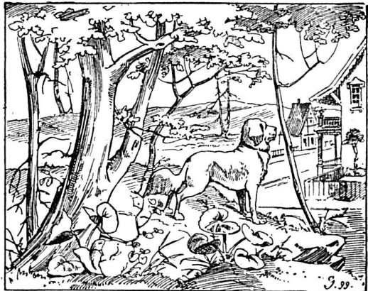
Où est le fils du patron?