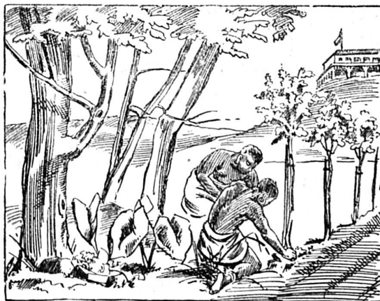
Où est le planteur ?

Cette simple histoire prouve que l'escargot des vignes n'est pas absolument dépourvu d'un sentiment voisin de la ruse; sa façon d'agir dénote en tout cas une part de raisonnement que nous n'avions encore jamais rencontrée chez lui. Nous signalons ce fait à l'attention des zoologistes, dont le rôle est aussi de montrer jusqu'à quel degré un animal, si inférieur soit-il, est capable de penser et de vouloir.