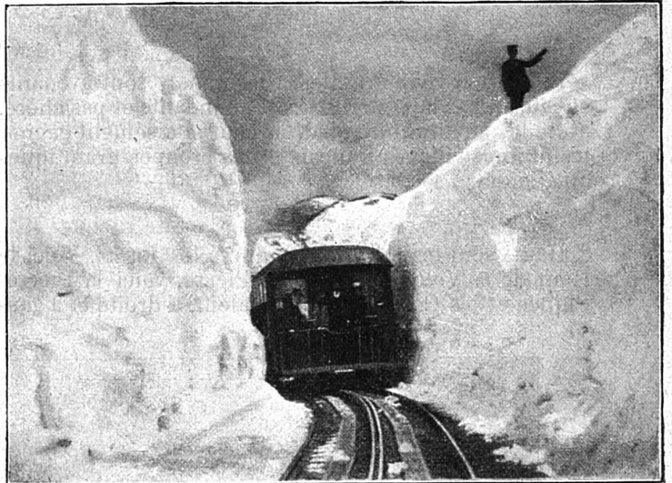
Sur le chemin du pic de Pike.

En résumé, l'ascension de Pike's Peak est une excursion charmante, d'autant plus que les jours nébuleux ou à clarté douteuse sont, dans cet heureux pays, des exceptions bien rares; l'air, pendant tous les mois