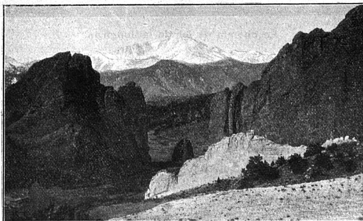
Le pic de Pike, vu de l'entrée du Jardin des Dieux.

Les trains se composent, ainsi qu'on peut le voir sur une de nos illustrations, simplement d'une machine de type spécial et d'un wagon. Ce dernier, qui peut contenir cinquante personnes, a des parois presque