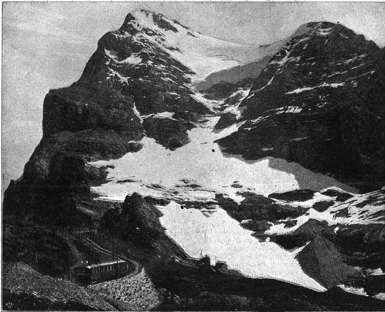
Le chemin de fer de la Jungfrau

Toutefois, même en admettant que la Jungfrau Bahn, dont nous reproduisons ici deux vues, soit un jour exploitée sur toute son étendue, son point culminant