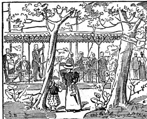
Où est le chef d'orchestre?

— Parbleu! un volontaire de quatre-vingt douze!