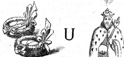
Solution du rébus paru dans le N° 24

Bienheureux les miséricordieux parce qu'ils obtiendront miséricorde.