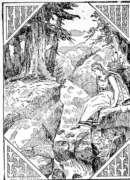
Où est le chevalier?

Bienheureux Lem Isère I corde yeux part c' œufs qu' Il sob tient d' rond mi ser I cor de.