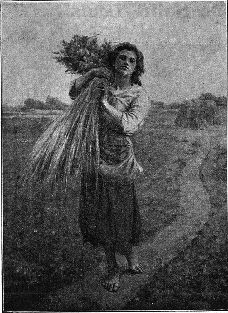
Glaneuse, par Jules Breton.

De tous les types qu'il a créés, M. J. B. garde une préférence pour cette figure de glaneuse qui vient à nous, droite, campée comme une statue, soutenant une gerbe sur son épaule.