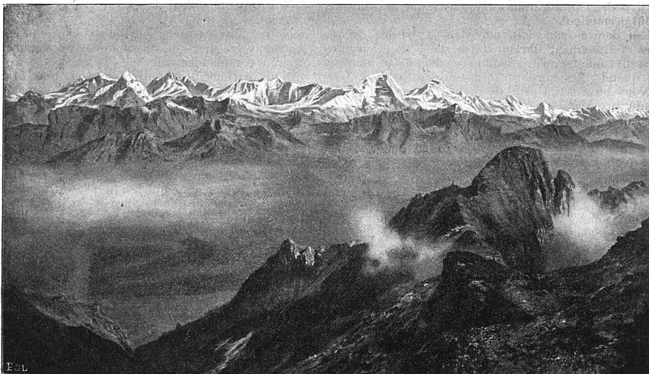
Panorama du Rothorn près de Brienz (Oberland bernois)

Les Alpes bernoises présentent un des tableaux les plus majestueux non pas des Alpes suisses seulement, mais de toute l'Europe. La sommité de laquelle l'apiniste peut jouir le plus intensément d'une vue générale sur cette succession de glaciers imposants est peut-être le Rothorn près de Brienz (altitude 2351 mètres). Son sommet est le plus élevé de tout le massif qui s'étend entre le Garder près d'Interlaken jusqu'au Brünig enclavant le lac de Brienz. Ce Rothorn est une montagne intéressante,