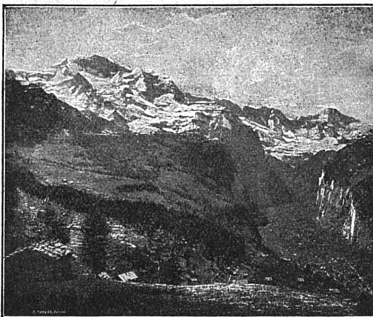
Lauterbrunnen et la Jungfrau

Environ 20 petits ruisseaux se précipitent dans le voisinage du haut des rochers. Le plus remarquable forme la chute du Staubbach. Cette masse d'eau tombe librement d'une hauteur de 300 mètres et est réduite en poussière avant