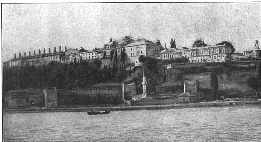
Constantinople : Le vieux sérail, vu du Bosphore