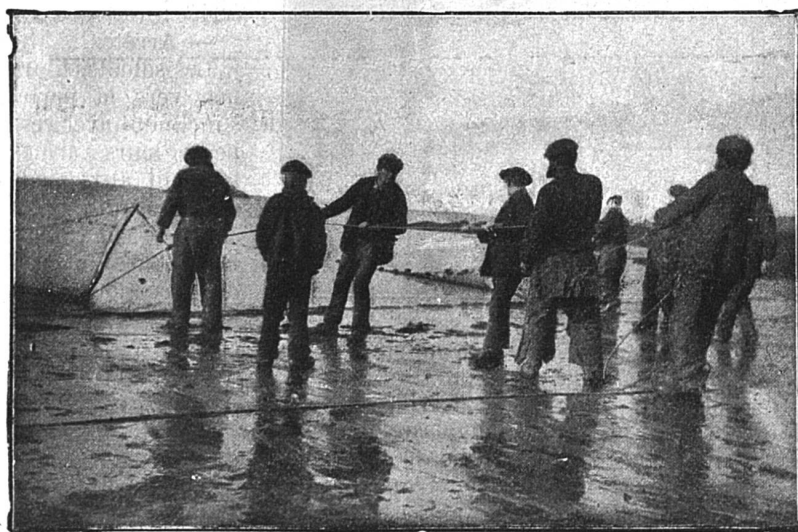
L'emplacement des filets

carrière, combien de proies il a arrachées à la mer en furie. Son visage, aux traits accentués, respire la sérénité, la tranquille assurance de l'homme qui ne craint pas la mort mais la brave pour l'amour du prochain.