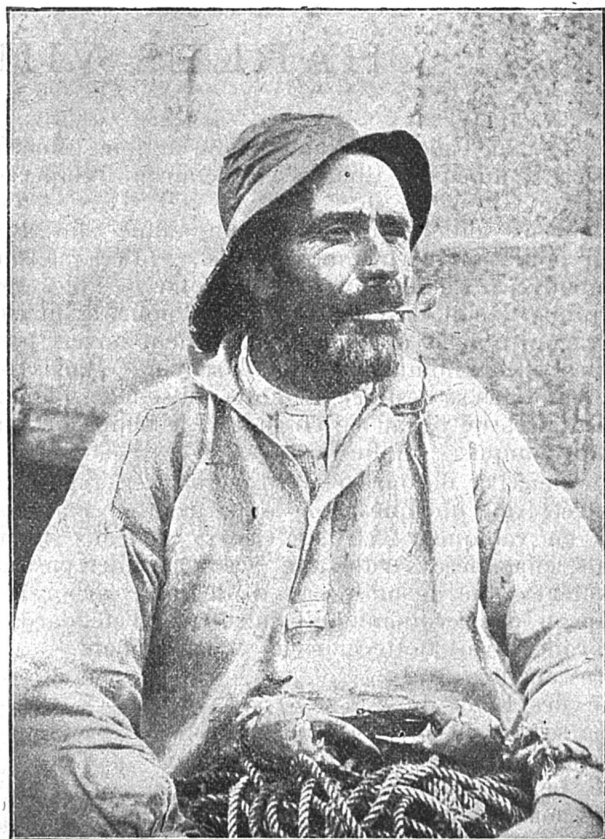
Patron de bateau de sauvetage

Notre image nous fait voir un patron de barque de sauvetage. Qui sait combien de vies il a sauvées dans sa