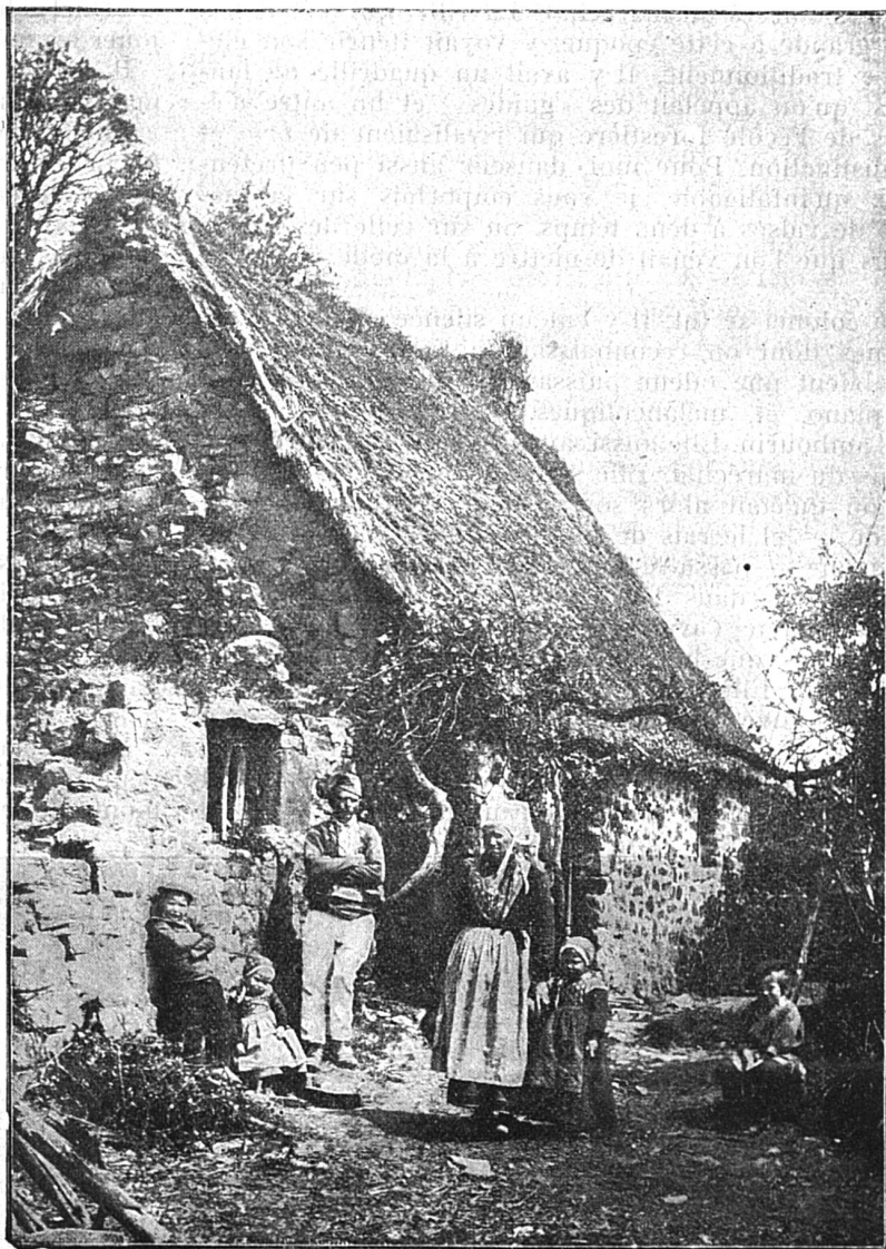
Cabane de Pêcheurs

La sardine est, comme chacun le sait, une source de richesse pour la Bretagne. 40.000 pêcheurs environ s'adonnent à la pêche, qui n'est malheureusement pas toujours fructueuse. Ces pêcheurs, qui mènent une existence souvent bien misérable, habitent pour la plupart de pauvres cabanes de pierre, recouvertes de chaume ou de branchages ; l'intérieur en est des plus rustiques. De bonne heure déjà, on va jeter les filets dans le voisinage