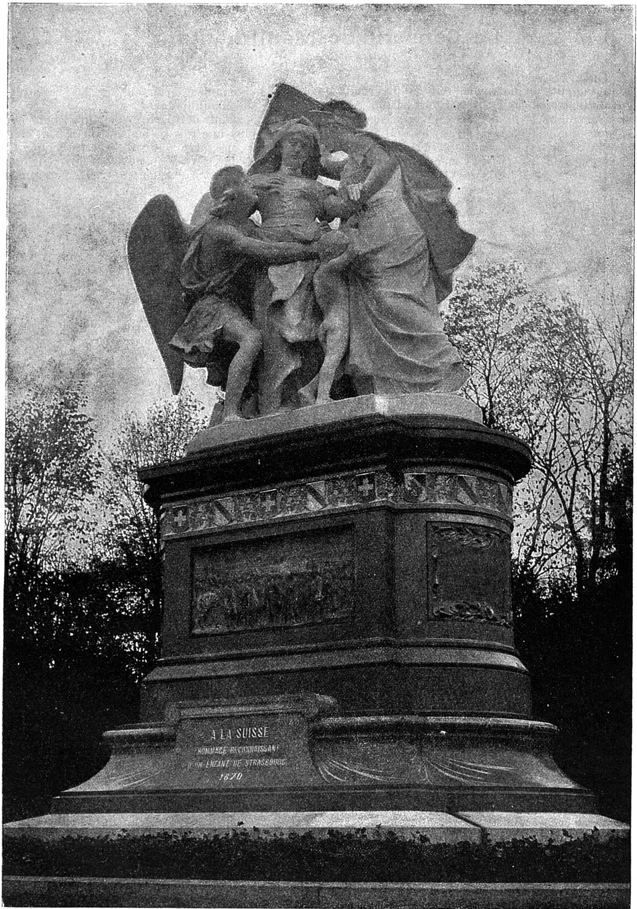
Le Monument de Strasbourg à Bâle