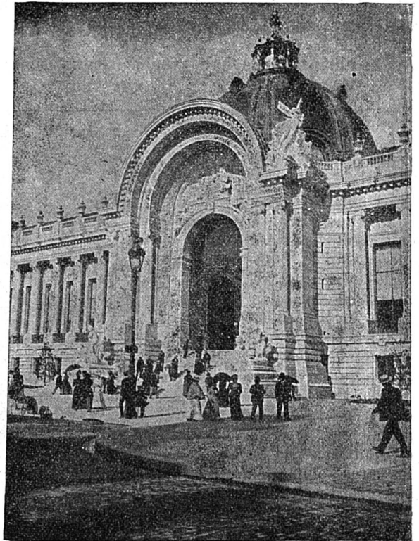
Paris : Façade du Petit Palais.

Et le gardien moustachu, du bout de sa canne, me montre une inscription en grosses lettres au-dessus de la porte : Hôpital Tenon .