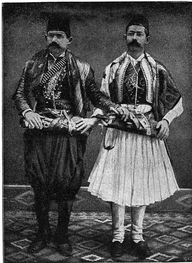
Albanais de nobles familles