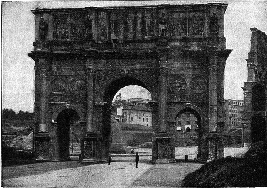
L'arc de triomphe de Constantin à Rome

— Vous lui apportez un opéra, je vois cela à votre manuscrit ; avez-vous de l'argent ?