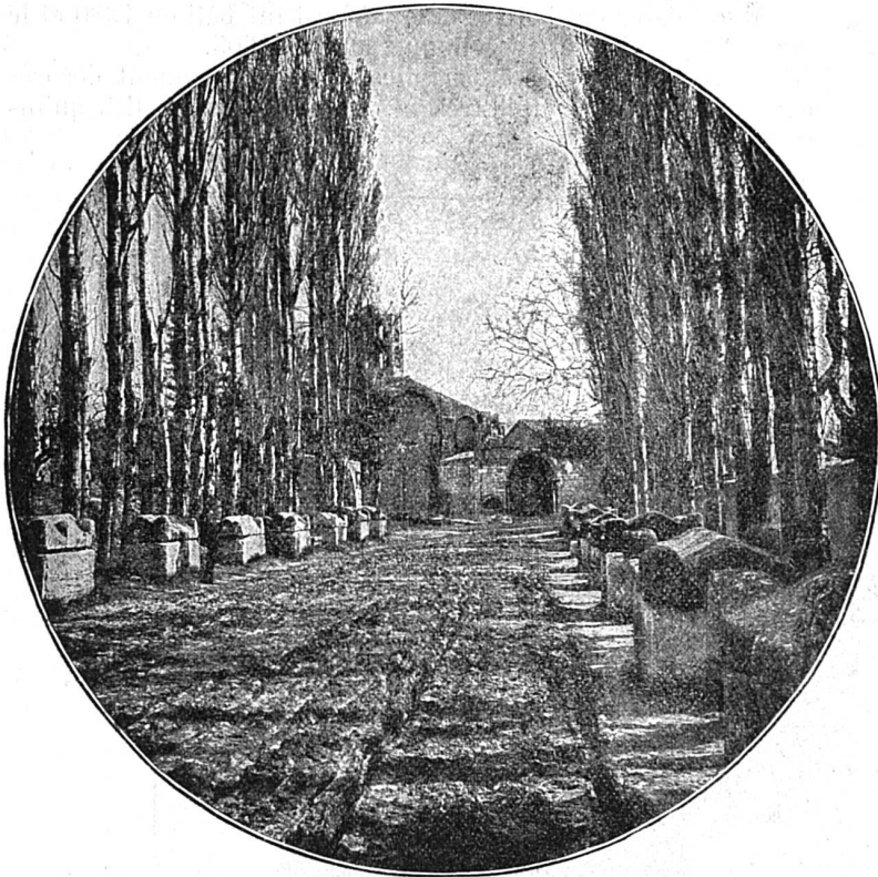
Arles : Cimetière d'Alyscamps

Elles portent une très jolie coiffure, consistant en un petit bonnet à bandeaux, crânement posé sur le chignon, derrière la tête. Une gentille robe, ordinairement foncée, claire et voyante les jours de fête, descendant jusqu'à la cheville du pied ; de superbes tailles à dentelles et une très élégante chaussure complètent leur accoutrement.