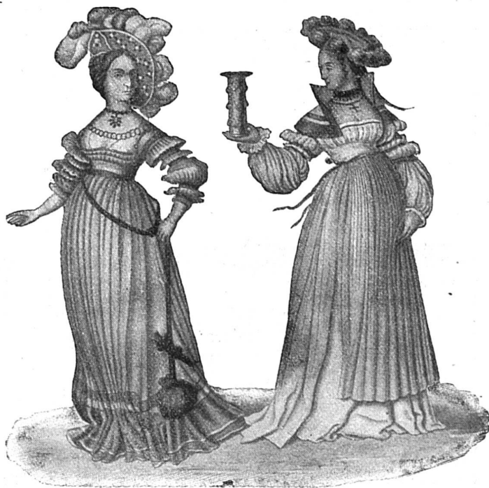
La toque au XVI e siècle

Elle posa les bouquets à l'intérieur du grillage qui entoure le chœur, mit genoux en terre, s'assura qu'elle était seule par un regard circulaire, leva sa voilette, joignit les mains, et les yeux suppliants, fixés sur la