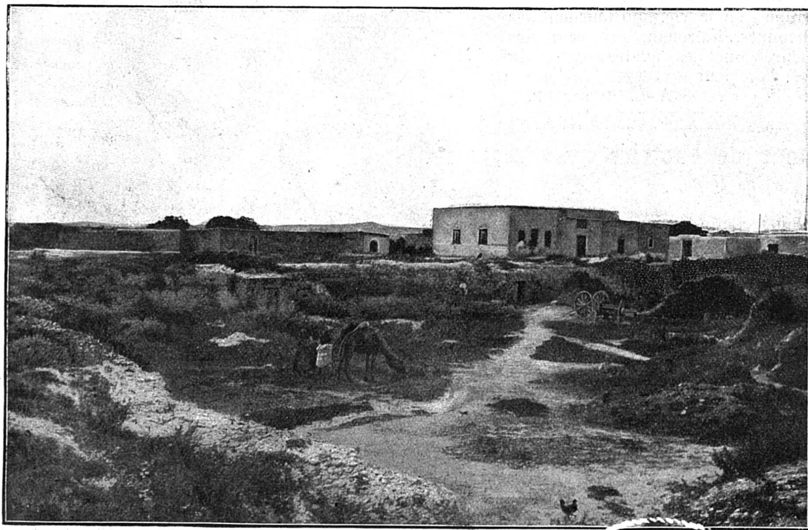
Village indigène bâti dans les citernes de Carthage

Comme nous l'avons dit, cette ville a longtemps résisté à la curiosité étrangère; même au temps des barbaresques, jamais les prisonniers chrétiens n'ont été conduits à Kairouan. Ce n'est que plusieurs années après l'entrée de l'armée française en Tunisie que les chrétiens purent parcourir ce centre. Des troubles survenus lors des