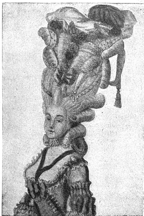
Chapeau de l'année 1780