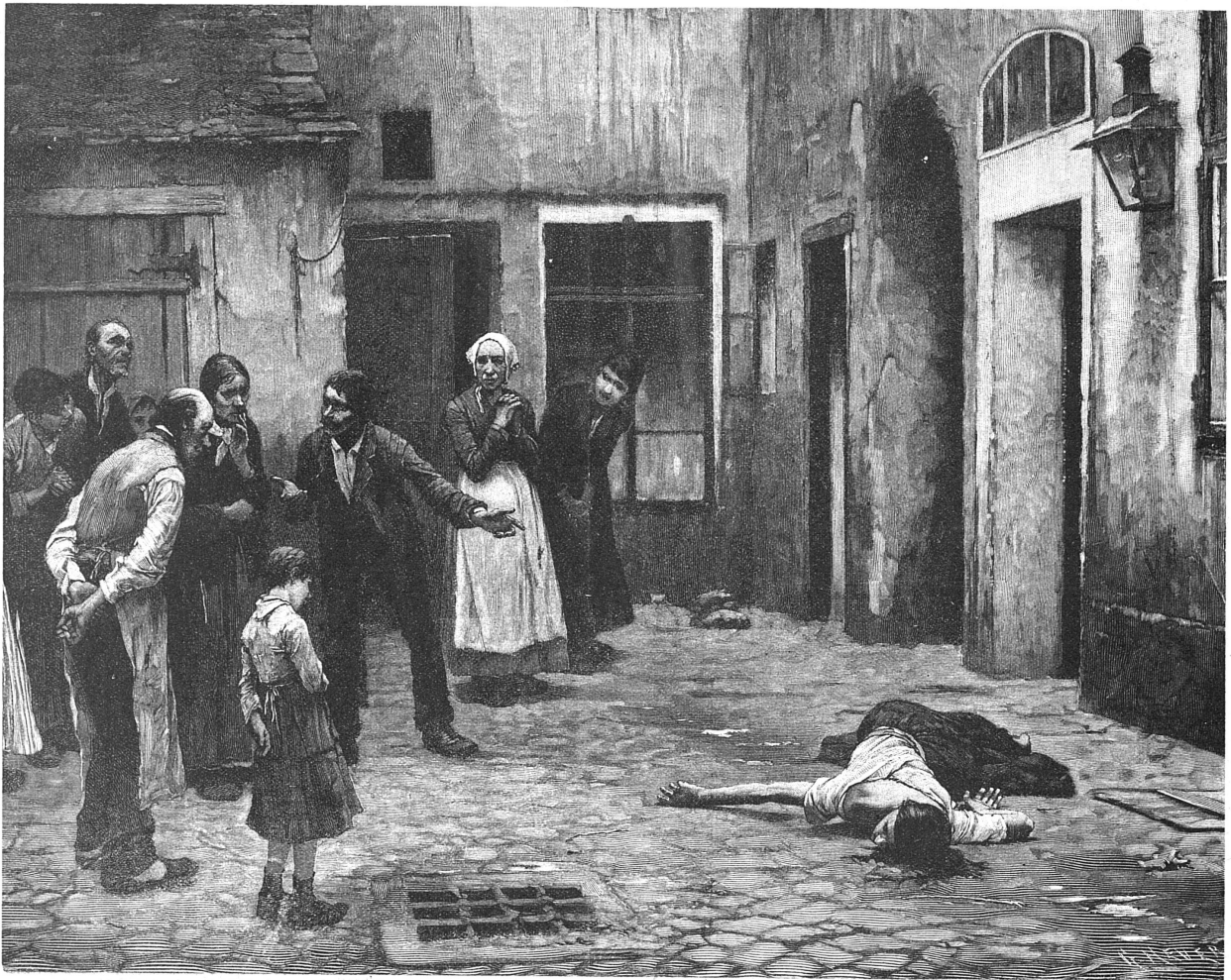
Le drame du faubourg (de J. Schikaneder).