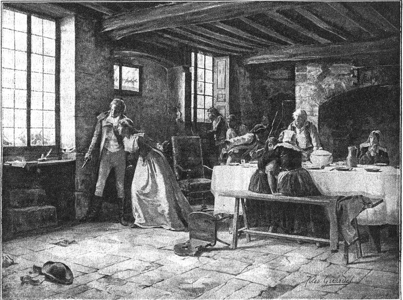
La poursuite (Tableau de Jules Girardet)

— Dieu t'entende! dit la vieille saunière. Mais je comprends, ajouta-t-elle, tristement, en regardant la toilette de la jeune fille: tu veux aller à la ferrade, et c'est pour cela que tu trouves que le marin n'est pas mauvais. Ecoute, Manidette: assez de mystères. J'ai deviné une partie du secret de ton cœur le jour