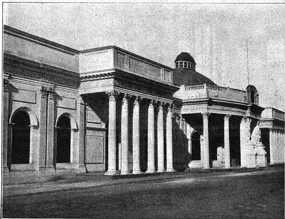
Le palais du gouvernement à Caracas.

« Ce ne sera, du reste, qu'un marin blanc, reprit