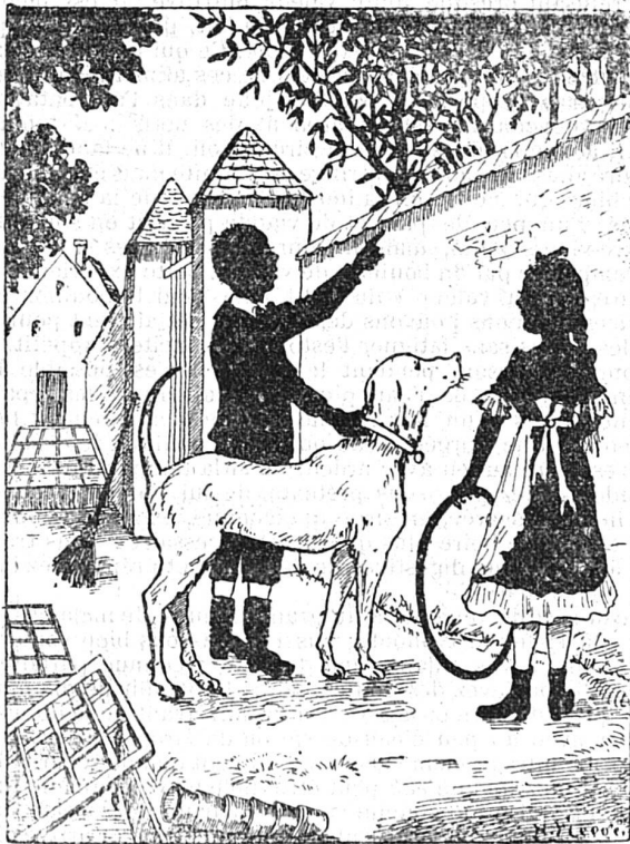
Où est le petit chat ?