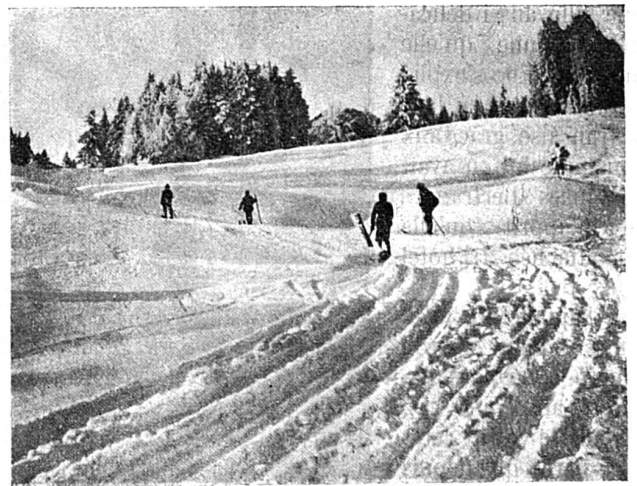
Chemin parcouru par les skieurs près de St-Cergues