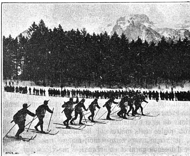
A Glaris (22 janvier 1905) Le départ de la course des sous-officiers et soldats

actuellement les 25 mètres, et le record norvégien est de 35 mètres environ. Que ferons-nous après avoir décrit cette fabuleuse trajectoire ?