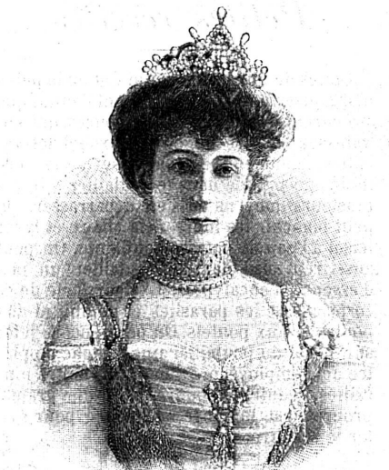
La reine Maud de Norvège.