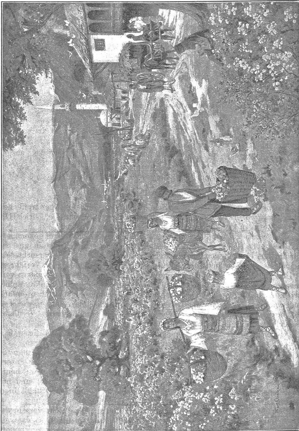
Rosenernte am Balkan.

mit der menschlichen Ansiedelung, und endlich über die Fischerszene, beim andern über den Balkan, diese wichtige Klimascheide, seine Pässe, namentlich den geschichtlich berühmten Schipkapass, über die herrlichen Rosenfelder auf der Südseite des Gebirges, sowie über die gemischte Bevölkerung dieser Landschaft.