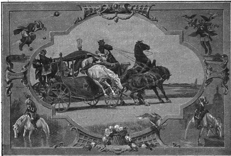
Nr. 19. Münchhausens Abenteuer.

1. Meinholds deutsche Märchenbilder für Schule und Haus. Von dieser Sammlung künstlerischer Wandbilder, deren Hauptzweck Förderung der ästhetischen Erziehung der Jugend ist, liegt uns als neue Darstellung vor: Nr. 19. Münchhausens Abenteuer nach dem Original von Paul Hey. Er hat wirklich gelebt, der edle Freiherr von Münchhausen, auf seinem Rittergute Bodenwerder im hannoverschen Wesertale. Seine Abenteuer, welche unser Bild veranschaulichen will, werden darauf in drei Gruppen vorgeführt als Luft-, Wasser- und Landstrassenabenteuer. Den beiden erstern sind die Ecken der Bildfläche angewiesen, während das letztere als Hauptdarstellung die Mitte einnimmt. Dieses Mittelstück ist ein gar hübsches Bild. Auf der ebenen Landstrasse rollt eine fein geschnittene, reichverzierte Kutsche. Durch die Öffnung der Wagentür springt Münchhausens Schimmel von der einen Seite der Strasse nach der andern, ein fliehendes Häslein verfolgend. Gewandt schmiegt sich der Freiherr durch die enge Öffnung und vergisst nicht, im Vorbeifliegen