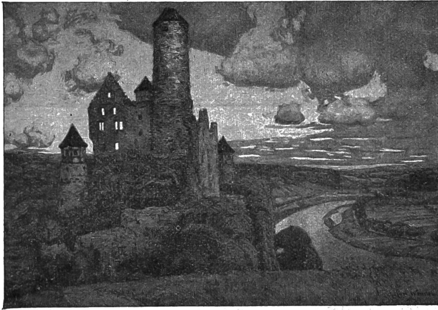
Nr. 8. Götz von Berlichingens Burg Hornberg am Neckar.