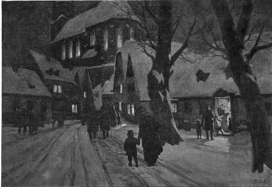
Nr. 24. Christmette.

2. Meinholds Bilder für den Anschauungsunterricht. Die neue Sammlung umfasste bis jetzt folgende zwölf Darstellungen: Frühling: Nr. 1. Mühle, Nr. 2. Auf dem Felde, Nr. 3. Garten, Nr. 4. Wald; Sommer: Nr. 7. Kornernte, Nr. 8. Heuernte; Herbst: Nr. 15. Weinlese Nr. 19. Bauernhof; Winter: Nr. 20. Mühle, Nr. 21. Auf dem Christmarkt, Nr. 22. Wald; Verkehr: Nr. 26. In der Grossstadt.