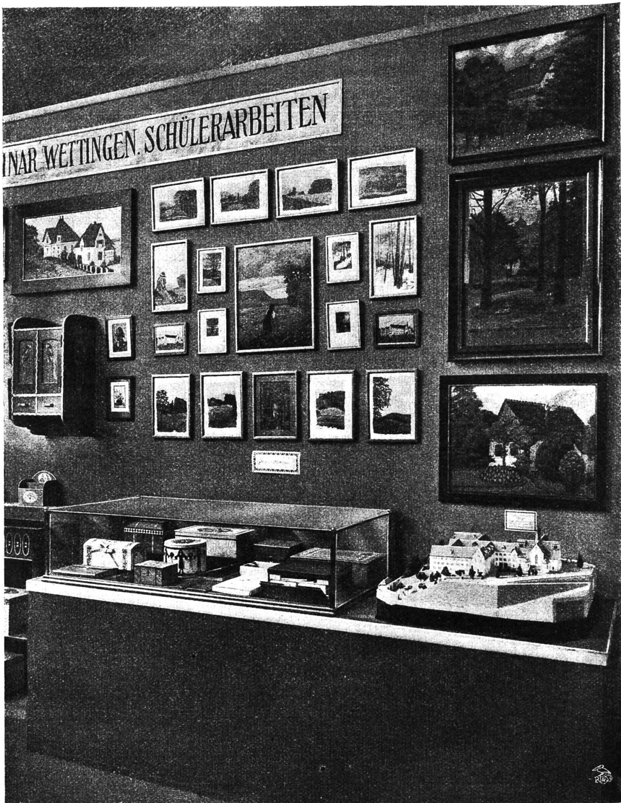
Zeichnen und Handarbeit (Seminar Wettingen).

Schulfächern beisammen findet, was zusammengehört, wird bedauern, dass nicht ein ähnlich angelegter Katalog ihm Wegleitung durch die reichhaltige Ausstellung bieten konnte. Doch was geschehen, kehrt