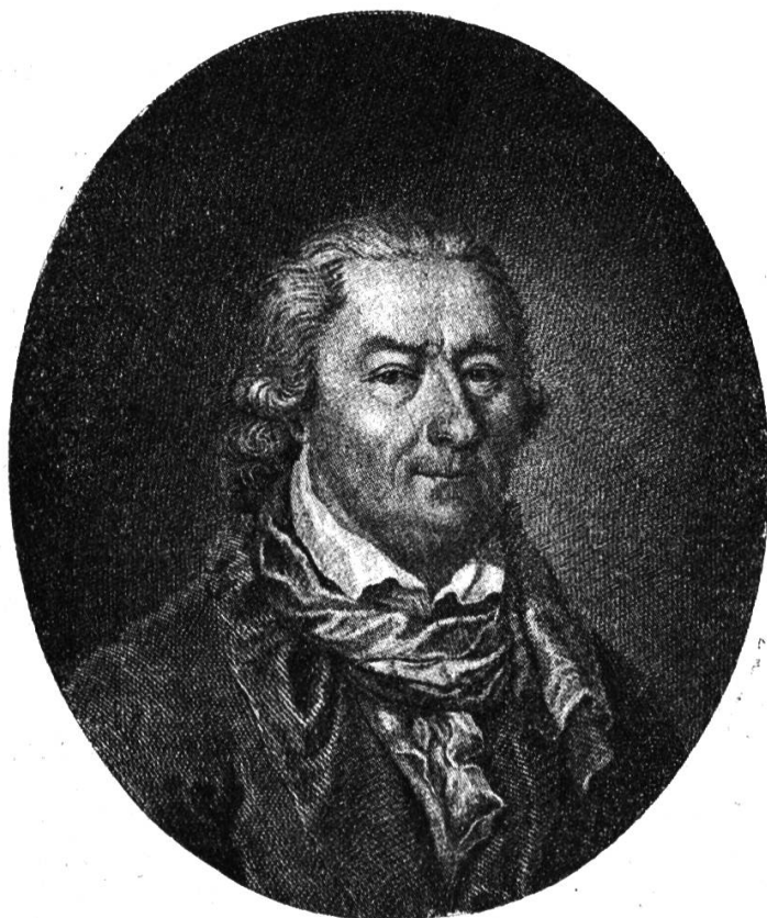
Johann Rudolf Tschiffeli

Inhalt: Johann Rudolf Tschiffeli. — Lavater, Tschiffeli und Pestalozzi. — — Vom Lichtbilderdienst des Pestalozzianums. — Neue Bücher - Bibliothek. — Neue Ausstellungen im Pestalozzianum.