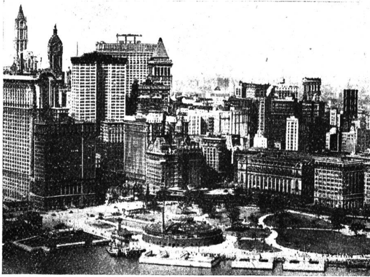
New York, Wolkenkratzer.

Es konnte eine Serie « New York » in unsere Sammlung eingestellt werden, die auf Originalaufnahmen des Herrn E. Ganz in Zürich beruht und ein recht eindrucksvolles Bild der Weltstadt vermittelt. Wir bringen im folgenden das Verzeichnis der Serie (weitere Bilder liefert die Firma Ganz u. Cie., Bahnhofstraße 40, Zürich):