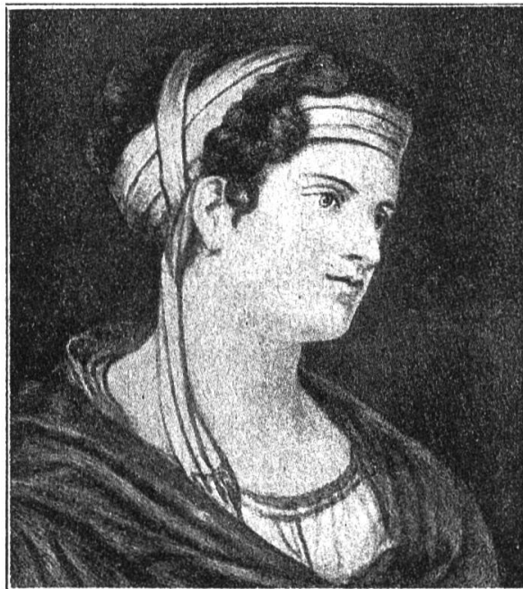
Gräfin Therese Brunszvik Originalgemälde im Beethovenhaus in Bonn

Die diesjährigen Jahrhundertfeiern Pestalozzis und Beethovens haben die Aufmerksamkeit der Kulturwelt auf eine Frauengestalt gelenkt, die mit beiden unsterblichen Größen in unmittelbarem Verkehr gestanden ist. Durch Beethoven wurde sie zur «unsterblichen Geliebten» geweiht, durch Pestalozzi zum «unsterblichen Schutzengel» der Kinderwelt. Während jedoch das Problem «Beethoven-Brunszvik» in der aus-