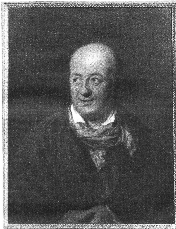
Salomon Geßner 1730–1788