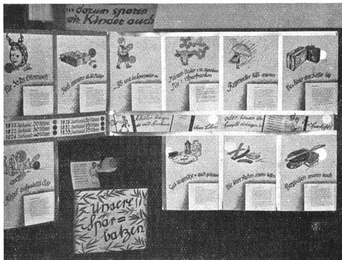
Vater und Mutter sparen, ... darum sparen wir Kinder auch.

eine Form von einem Rock aus rotem Stoff. Jetzt fing ich an zu nähen. Am Anfang ging es sehr gut, und ich meinte, ich könne und verstehe jetzt auf der Maschine zu nähen. Aber auf einmal machte es brr. Die Maschine nähte einfach nicht mehr. Ich schnitt den Faden ab und nahm den Stoff... Md. II. Sek.-Kl.