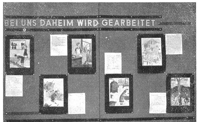
Bei uns daheim wird gearbeitet.

An der Nähmaschine. Im Winter ist meine Mutter fast täglich am Nachmittag an der Nähmaschine. Da flickt sie wieder eine Schürze, bald einen Rock, bald ein Hemd. Bald verfertigt sie ein neues Schürzlein aus einer ganz alten Schürze. Ich war als kleines Kind immer ihr Zuschauer; denn das interessierte mich sehr. Schon bevor ich in der ersten Klasse war, wollte auch ich lernen, an der Maschine zu nähen. Jedoch die Mutter gab mir die Erlaubnis nicht und sagte immer: Du würdest mehr verderben als nähen. Doch bald musste ich in die Arbeitsschule. Da sprach ich zur Mutter, als sie einmal an der Maschine war: Jetzt musst du mir aber auch zeigen, wie du auf der Maschine nähst, dass ich etwas kann in der Arbeits-