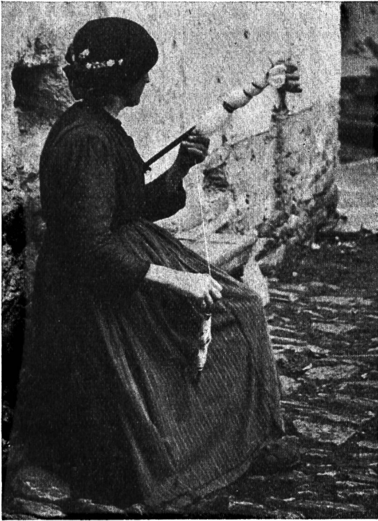
Tessinerin mit Spinnrocken und Spindel in Sonogno.