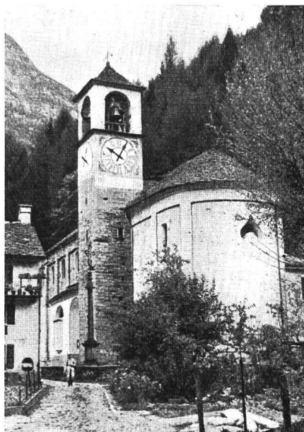
Die Kirche in Brione (Verzasca).