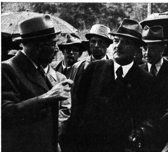
Bei Ponte Brolla: