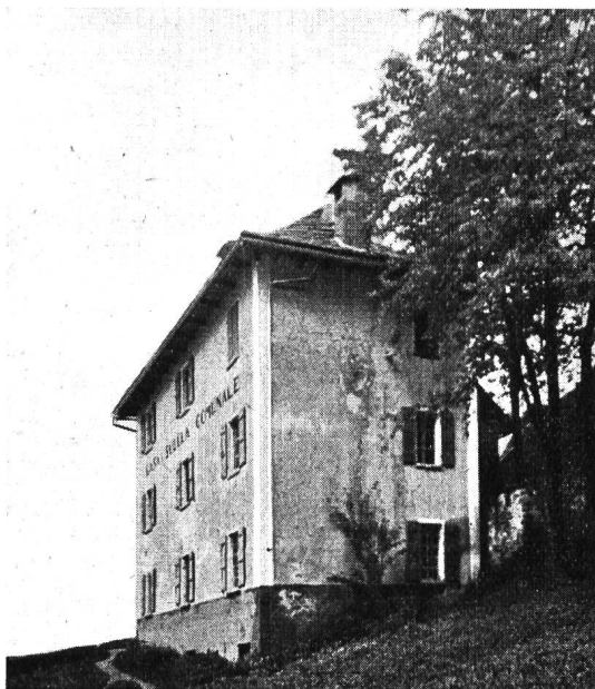
Schulhaus in Sonogno.

Seit Jahren wirbt das Pestalozzianum durch eindrucksvolle Ausstellungen für die Arbeit in Schule, Haus und Volk. Laien und Fachleute zählen zu seinen eifrigen und getreuen Besuchern. Wenn es bisher Gutes und Schönes im Lande sammelte, in seinen Ausstellungsräumen zur Schau stellte und uns freundlich einlud, auf Besuch zu kommen , so hat es mit dieser Herbsttagung den Versuch gewagt, einmal auf Besuch zu gehen . Und er ist wohl gelungen. Die Tessiner Presse hat der «settimana pedagogica» erfreuliche Beachtung geschenkt und für die Teilnehmer auch schon den Ausdruck geprägt, der vielleicht am besten den Geist kennzeichnet, aus dem die Veranstaltung hervorgegangen ist: «i pestalozziani» — Pestalozzianer. «Um von Menschen zu reden, muss man Menschen kennen», sagt ein Pestalozziwort. Um dieses Kennen-