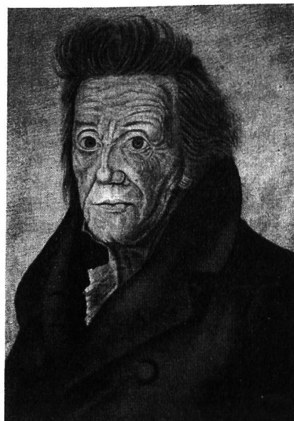
Joh. Hch. Pestalozzi