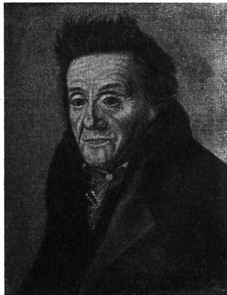
Joh. Hch. Pestalozzi

Böse Menschen kläubeln und wörteln ob den Rechten der Väter des Landes, und Söhne der Eitlen und mehr noch der Reichen stossen Söhne des Volkes von