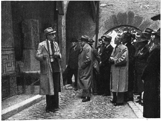
Römische Funde im Museum zu Nyon.