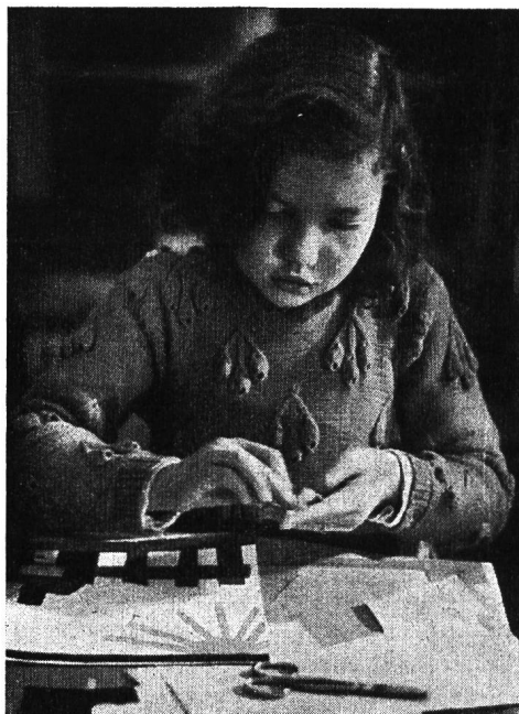
Selbstgemachtes Spielzeug. Kinder kleben ein Bilderbuch.

Nahmen so die äusseren Veranstaltungen einen erfreulichen Verlauf, so darf auch auf eine befriedigende Entwicklung der internen Tätigkeit hingewiesen werden. In Bibliothek und Lesezimmer zählten wir im ganzen 6168 Besucher (4610 aus der Stadt Zürich, 1217 aus dem übrigen Kanton und 341 aus andern Kantonen). Die Bibliothekskommission, die über die Anschaffungen für unsere Bücherei entscheidet, hat in sechs Sitzungen ihre Vorschläge bereinigt. Es sind 1017 Bände in unsere Bibliothek eingereicht worden — Doubletten nicht gerechnet — die, als grösste pädagogische Bibliothek unseres Landes, nunmehr etwa 75 000 Bände zählt.