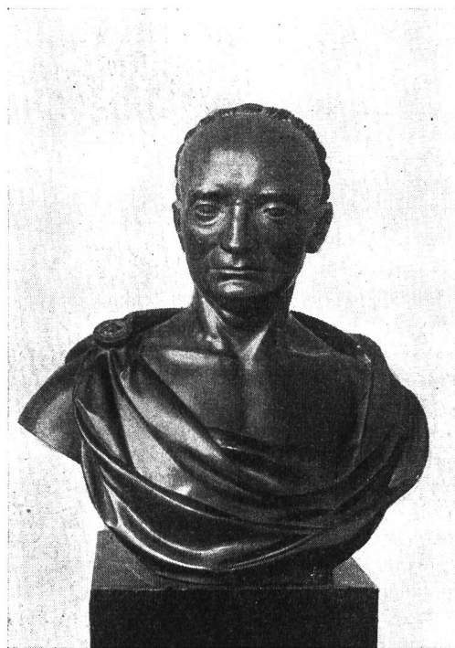
Joh. Conrad Heidegger (1710 – 1778)

Fichtes und Goethes bei dem berühmten Arzte erinnert. — Der Schweizer Bücherhilfe stellten wir für eine Hilfsaktion zugunsten der staatlichen sozialpädagogischen Schule in Zagreb, die durch das Ministerium für Sozialpolitik veranlasst wurde, eine Liste schweizerischer Erziehungsschriften zur Verfügung. — Dem Schweizerischen Buchhändlerverein wurde für eine Buchausstellung in London ein Verzeichnis jener schweizerischen Schulbücher übermittelt, die durch Inhalt und Ausstattung hervorragten. In solchen Fällen zeigt sich deutlich, wie wichtig vom nationalen Standpunkt aus eine Stelle ist, die der Entwicklung der schweizerischen pädagogischen Literatur dauernd ihre Aufmerksamkeit schenkt und den mannigfachen erzieherischen Leistungen unseres Landes nachgeht. — Eine besondere Freude war es uns, die schweizerischen Erziehungsdirektoren anlässlich ihrer Konferenz in Zürich bei uns im Pestalozzianum begrüßen zu kön-