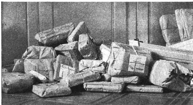
Die «Ernte» eines Morgens Rücksendungen an das Pestalozzianum

(Fortsetzung und Schluss des Jahresberichtes folgen in nächster Nummer).