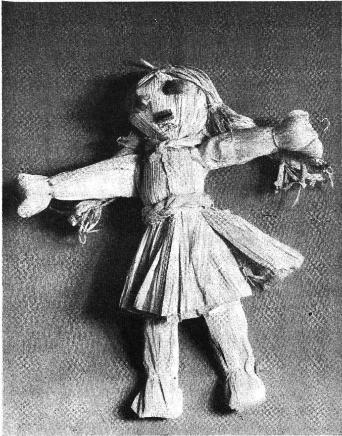
Aus der Ausstellung der Zürcher Kindergärtnerinnen im Beckenhof: Selbstgefertigte Puppen

Ein Beispiel aus vielen mag das erhärten: Der Schweizerkonsul in Hamburg soll einem dortigen Senator, der in Schulfragen zuständig ist, über folgende Fragen Auskunft geben und wendet sich infolgedessen an unser Institut mit dem Ersuchen um Mitteilungen über die «Gestaltung der Grundschule (vier oder sechs Jahre?), weitere Formen des Ausbaues (Primarschule, Progymnasium, Gymnasium), Uebergang von der Elementarschule in die Mittelschule, Beginn der Alt- und Neusprachen im Unterrichtsplan, Schulgeldfrage, Lehrmittelfreiheit». — In Zukunft wird ein schweizerisches pädagogisches Lexikon in derartigen Fällen die erwünschte Auskunft erteilen. So hoffen wir!