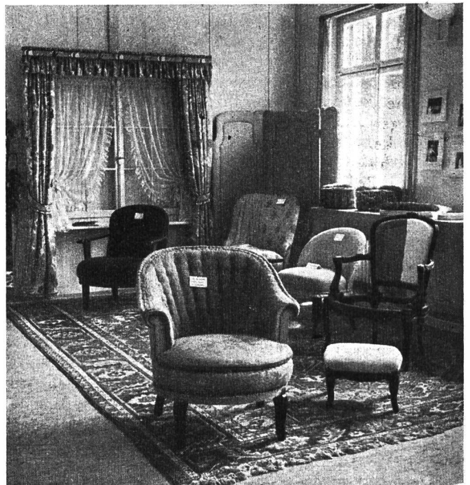
Gewerbliche Abteilung

8. Auskünfte. Anfragen aus dem In- und Ausland stellen bei der Vielgestaltigkeit unseres schweizerischen Schulwesens oft recht hohe Anforderungen.