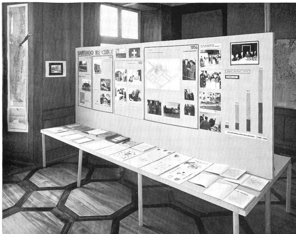
Aus der Ausstellung «Die Schweizer Schulen im Ausland».

Im Reglement über die Lehrmittelkommission des Schweizerischen Verbandes für Gewerbeunterricht wird das Pestalozzianum als Lehrmittelzentrale des deutschsprachigen Landesteiles der Schweiz auf dem Gebiet der gewerblich-industriellen Berufsbildung bezeichnet. Die reichhaltige Sammlung von Lehrmitteln für die gewerb-