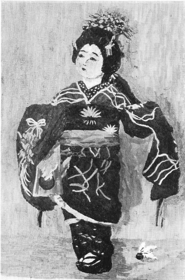
Aus kleinen Stoffresten angefertigtes Bildnis einer Japanerin. Geschenk aus Hiroshima.

Archivs der Schweizerischen permanenten Schulausstellung», der 1880 in den Titel «Schweizerisches Schularchiv» umgewandelt wurde. Seit jenen Anfängen wurde ein reiches, einzigartiges Material zusammengetragen. Es umfasst Verordnungen und Gesetze, Programme und Aufsätze, die das Schulwesen der ganzen Schweiz betreffen. Wir erachten es als unerlässlich, durch neue Bemühungen die Bestände zu ergänzen und auch die neueste Entwicklung zu erfassen. Das Schularchiv wird für wissenschaftliche Arbeiten, zur Dokumentation und — wegen der Vielgestaltigkeit der schweizerischen Schuleinrichtungen — zur Auskunftserteilung wertvolle Dienste leisten.