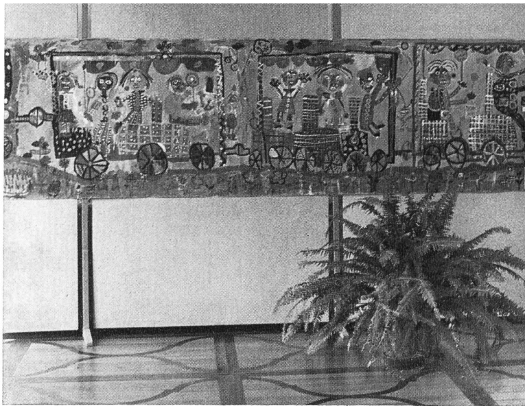
Ausstellung «Offene Malkurse der Stadt Wien»

Sämtliche Veranstaltungen waren sehr gut besucht. Wir sprechen der Stipendiatsstiftung der Schweiz. Vereinigung der Freunde Finnlands unseren herzlichsten Dank für den namhaften finanziellen Beitrag aus, der es ermöglichte, dass Frl. P. Vilppunen sich drei Monate lang in Zürich aufhalten konnte. Sie erteilte an zwei Volksschulklassen den Turnunterricht und stellte ihre Dienste dem Kantonalen Fraueturnverband, dem Lehrerinnenturnverein und dem Akademischen Sportverband mit Freude und Hingabe zur Verfügung. Fer-