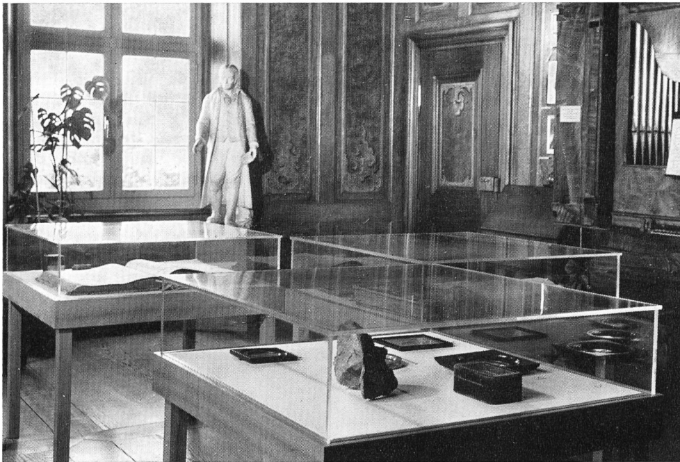
Teilansicht eines der drei Pestalozzi-Zimmer