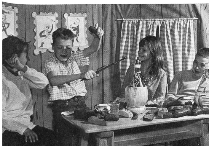
Eröffnung der Jugendbuchausstellung Eine Primarklasse spielt die «Bremer Stadtmusikanten»

Das von der erziehungsrätlichen Kommission verfasste Reglement über die Sonderklassen und die Sonderschulung im Kanton Zürich wurde im Verlaufe des Berichtsjahres den freien Lehrerorganisationen, dem