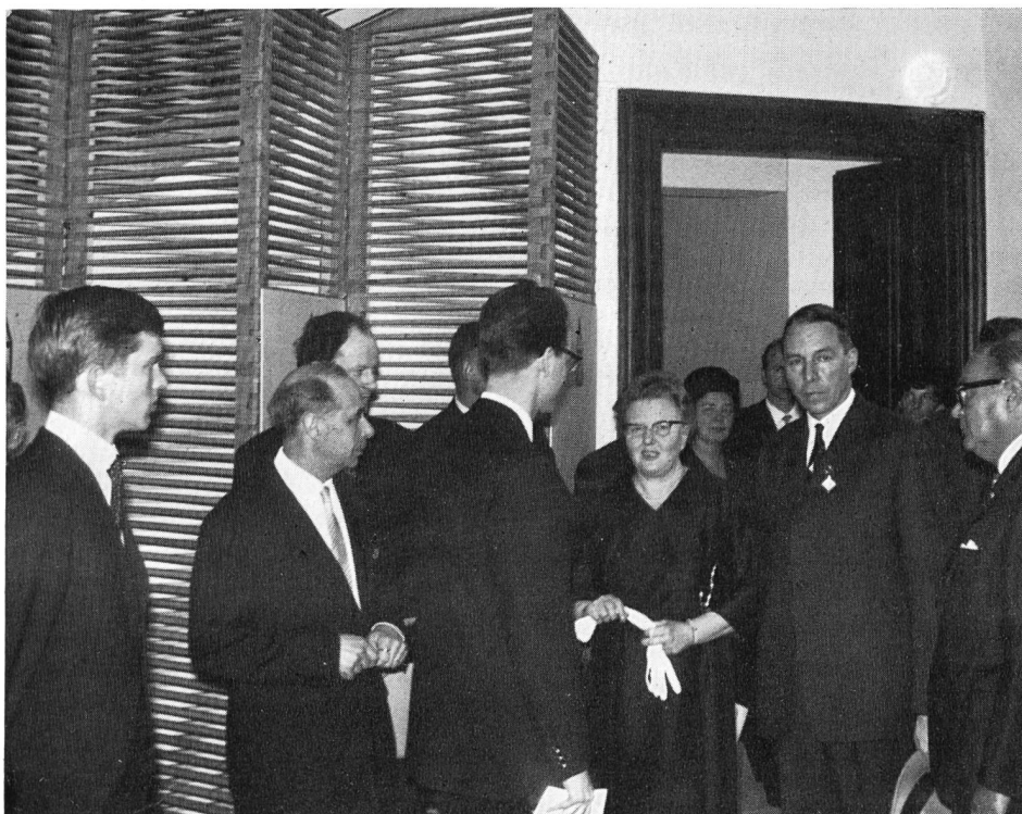
Eröffnung der Ausstellung «Die Schule in Finnland» Frau Minister H. Hosia, Vorsteherin des finnischen Unterrichtsministeriums, und Bundesrat Dr. H. P. Tschudi

Hauswirtschafts- und Arbeitslehrerinnen überprüften die Bücher ihrer Fachgebiete. Eine grosse Zahl alter Bände konnte ausgeschieden werden; für Neuanschaffungen musste bei der Erziehungsdirektion ein Sonderkredit eingeholt werden. Die Arbeiten am Katalog über Hauswirtschaft und Handarbeit sind so weit gefördert worden, dass im laufenden Jahr eine Druckvorlage erstellt werden kann.