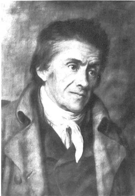
Ölgemälde von F. X. Ramos

Etude sur l'évolution de la pensée et de l'action du pédagogue suisse (1746–1827), 671 S. Publications Universitaires Européennes, vol. 105, Edition Peter Lang, Bern 1981