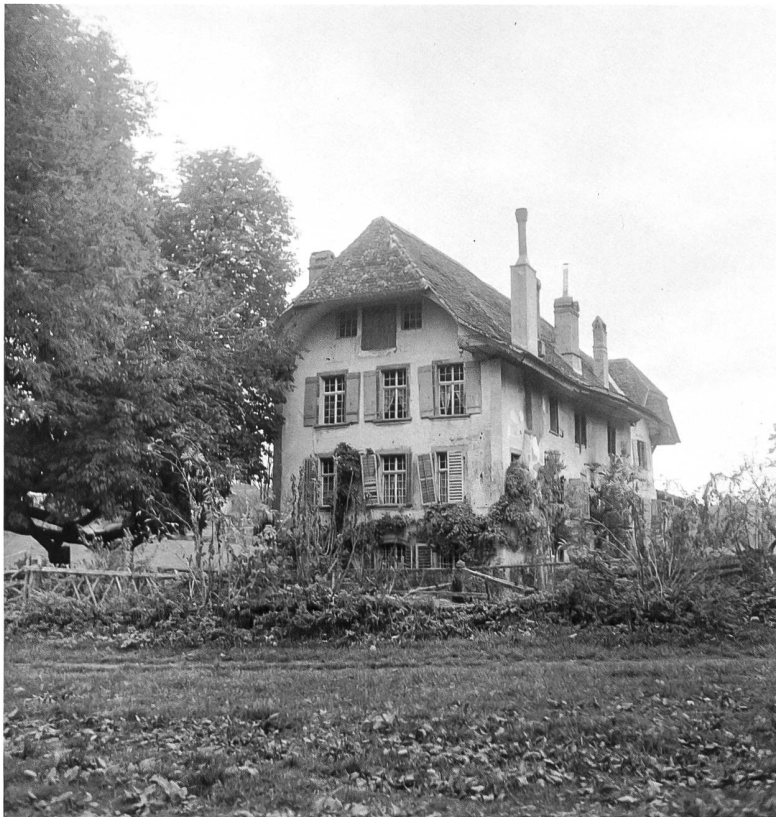
Les Monuments d'art et d'histoire du canton de Fribourg : le manoir de Misery photographié le 6 novembre 1944.