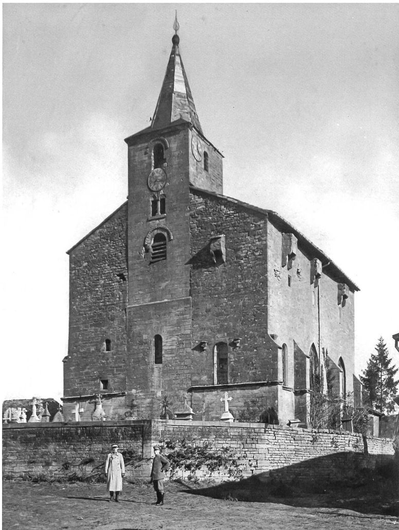
Le patrimoine épargné par la guerre : l'église fortifiée de Saint-Rémy de Saint-Pierre-villers (Meuse), classée monument historique en 1912.

se trouvaient sur un site protégé d'importance mondiale et qu'ils avaient détruit des vestiges archéologiques. Ces dégâts irréparables étaient dus à un manque de connaissances culturelles et historiques basiques, ces hommes ignorant ce qu'était la civilisation mésopotamienne et la notion même de patrimoine. En juillet 2009, suite aux protestations de la communauté internationale, l'armée américaine accepte de déplacer ses installations de 300 m. Elle aménage alors sa nouvelle base sur une zone archéologique intacte, détruisant du même coup d'autres vestiges non encore explorés par les archéologues 4 .