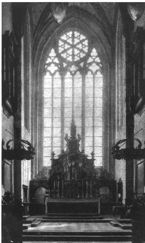
Fig. 97 Le tabernacle à son emplacement initial, dans le chœur d'Hauterive. Antérieure à la repose des vitraux en 1931, cette carte postale de 1910 environ montre la parfaite intégration du meuble baroque à l'architecture médiévale. La disposition très originale du tabernacle et de la Vierge de l'Assomption est sûrement inspirée de Wettingen.

objets de dévotion dans les cadres sans doute restés vides des deux ailes. En février 1762, le monastère de Montorge fut chargé de l'ornementation des deux reliquaires (fig. 100) et en juin on plaça les images de saint Jean-Baptiste et de saint Bernard, achetées à Augsbourg par le Père jésuite Techtermann (fig. 101). En vue de sa bénédiction abbatiale le 21 novembre 1763, Lenzbourg fit encore ajouter quelques clinquants aux deux reliquaires, par sœur Geneviève Seemann de Montorge. Très actif dans sa nouvelle charge, il eut l'occasion de se déplacer régulièrement en France, ramenant divers objets au goût du jour. En 1766, il se rendit au parlement de Dijon, pour défendre la cause de l'abbé de Cîteaux, qui l'emporta grâce à lui. Pour le remercier, le Père général lui offrit plusieurs pièces d'argenterie 16 . En plus, l'abbé d'Hauterive acheta à Dijon six chandeliers de cuivre argenté pour le «grand autel» (fig. 103). Le parement principal de ce tabernacle devait être un immense conopée, teinté par un certain Blondel en 1772, et