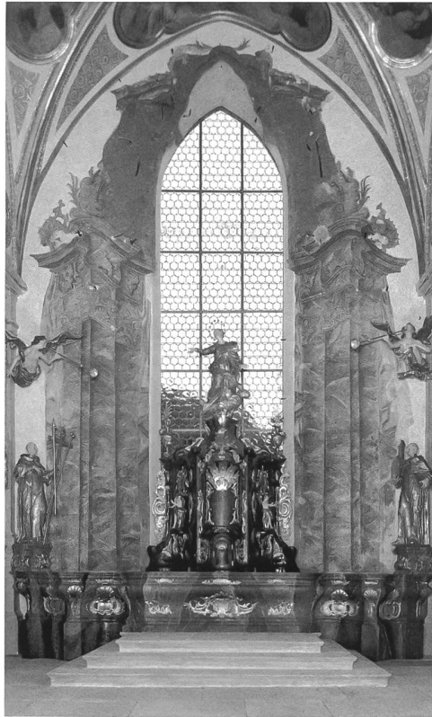
Fig. 98 Le tabernacle en bois sculpté et le retable peint en trompe-l'œil du maître-autel de l'ancienne abbaye cistercienne de Wettingen, 1751-1753. Photo prise lors de la récente restauration de l'église, en 1992, juste avant que le décor peint, qui n'avait à l'origine qu'un caractère provisoire, ne soit à nouveau caché par le retable sculpté de 1754-1755.

Son déplacement à Marly a donc permis la conservation du tabernacle d'Hauterive, mais il n'avait son vrai rayonnement que dans le chœur de l'église conventuelle. La grande fenêtre axiale était pour lui comme un retable. Son inscription parfaite devant cette vaste baie se mesure à quelques chiffres. Haut de 6,4 m, il atteignait exactement le milieu de l'ouverture, alors que sur les côtés, il descendait à 3,2 m pour une largeur de 6 m environ 18 . Sa partie supérieure formait ainsi un triangle parfaitement régulier. Pourtant, cette géométrie rigoureuse était simplement marquée par une suite de paliers – les grandes appliques des entrées latérales, les vases et les anges – conduisant à la Vierge de l'Assomption (fig. 97). Tel qu'il se présente actuellement à Marly, le tabernacle d'Hauterive est incomplet. Il lui manque les deux entrées latérales, qui à la fois allégeaient l'ensemble et lui donnaient une assise plus forte. La partie existante est un puissant assemblage de bois teinté en noir et verni, partiellement recouvert d'appliques en laiton et en cuivre doré. À l'origine, l'axe central était en plus rehaussé d'autres appliques, plus précieuses encore, en argent blanc. Assez fortement galbé, le tombeau