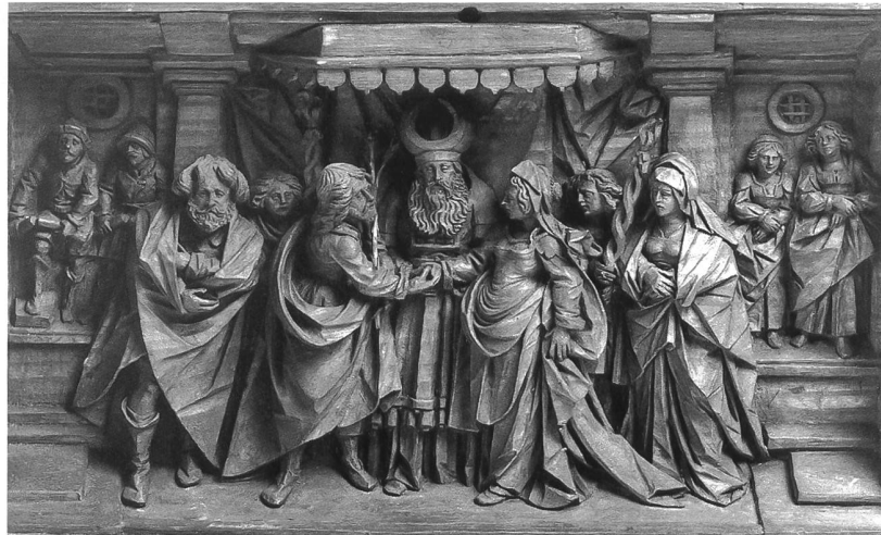
Fig. 114 Anonyme, le Mariage de la Vierge, 1 er quart du XVII e siècle, bois sculpté, 18 x 31,5 cm (Musée d'art et d'histoire de Fribourg, Inv. N° 3188, transféré d'Hauterive en 1855). – Faisant partie d'un cycle de la Vie de la Vierge et du Christ, ce haut-relief de provenance étrangère sans doute se trouvait initialement dans une chapelle de la famille Wallier.