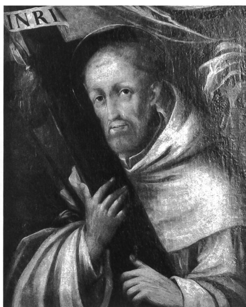
Fig. 116 Anonyme, Saint Bernard embrassant les instruments de la Passion, vers 1680?, huile sur toile, 70 x 57 cm (Chœur de l'église d'Hauterive). – Montrant l'un des thèmes favoris de l'iconographie baroque de saint Bernard, ce tableau appartient à un petit retable, qui se trouvait dans la chapelle dédiée au saint patron de l'Ordre.

retables en marbre de 1823, encadrant la grille du chœur (fig. 1), et ceux des chapelles latérales, de 1824 semble-t-il 31 . A cette occasion, on a probablement fait disparaître une bonne partie du mobilier antérieur, datant du XVII e siècle sans doute 32 . Pourtant, la réalisation majeure de la première moitié du XIX e siècle fut évidemment le grand orgue réalisé par Aloys Mooser en 1826 et considéré comme son œuvre la plus importante après les orgues de St-Nicolas de Fribourg 33 .