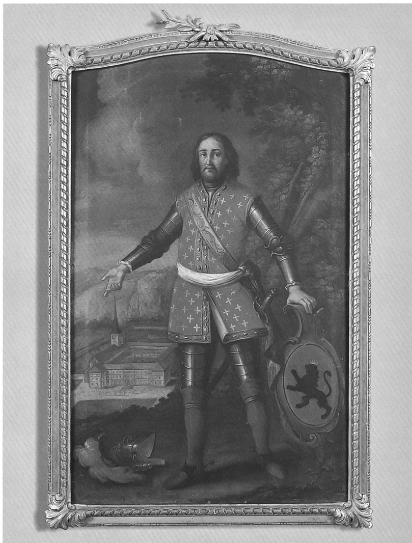
Fig. 123 Joseph Sautter, Guillaume de Glâne fondateur de l'abbaye d'Hauterive, 1777, huile sur toile, cadre: 163 x 103 cm (Abbaye d'Hauterive, salle St-Bernard).