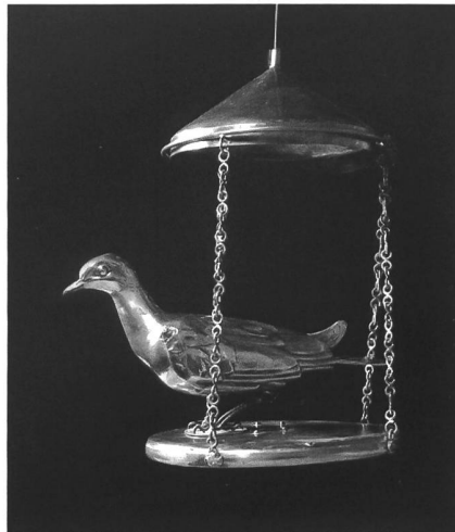
Fig. 128 Marcel Feuillat, Colombe eucharistique, 1953, argent, 28 x 48 cm, suspense en laiton placée au dessus du maître-autel. – Symbolisant parfaitement le désir de la communauté de revenir à ses sources médiévales, l'oeuvre de Feuillat reprend la tradition de la réserve eucharistique en forme de colombe, largement répandue en France du XI e au XVI e siècle et réactualisée au XX e , notamment à Solesmes, et dans plusieurs églises cisterciennes.