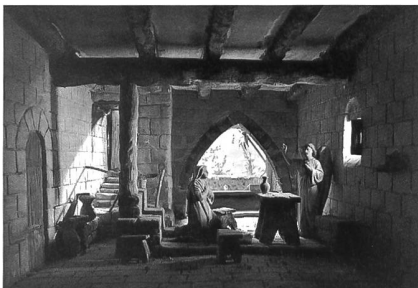
Fig. 127 L'Annonciation de la crèche d'Hauteville, réalisée au début des années 1950 par Frère Gilbert Galceran, de l'abbaye cistercienne de Poblet en Catalogne.

Premièrement J'ay la chambre meublée de deux garderobbes, d'un buffet, de 2 tables avec leurs tapis, de 3 coffres, de 3 escabeaux, de 2 chaires, d'un chasliet avec son ciel et rideaux, d'un oratoire avec son tapis, d'un esguiere et de son bassin. Item J'ay 3 brevieres, 3 dieurnaux avec leur tournefeuilles et au dedans quelques images tant en parchemin que d'autres. Item 5 chappellets avec leurs medailles dont les unes sont d'argent. Item 2 reliquaires d'argent y joinct une petite croix d'or avec leurs bourses et rubans; Item plusieurs images, tableaux et reliquaires a l'oratoire et aux parois de la chambre. Item plusieurs livres, un eaubenetier, un cilice, une discipline, un quadran, un petit horologe, et un reveil, Item 4. estuys garnys de leurs pieces dans l'un desquels il y a une cueillier d'argent, deux paires de cousteaux avec leurs