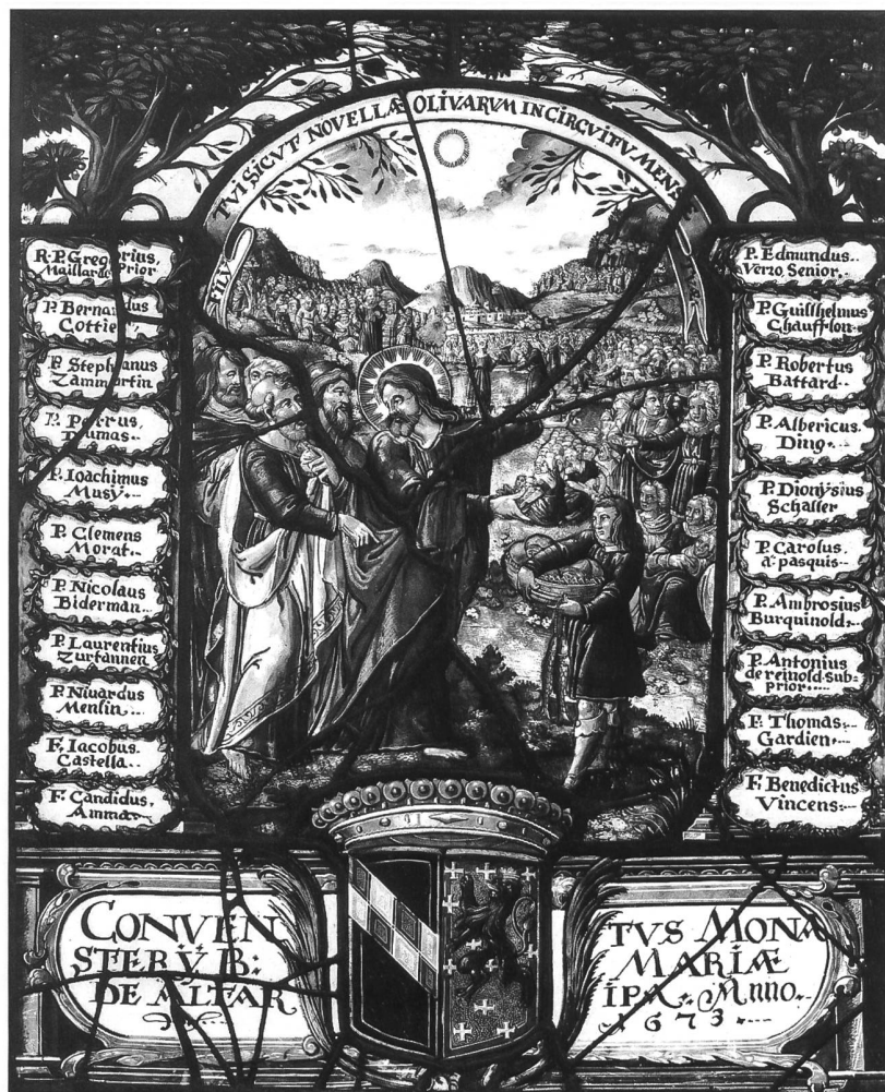
Fig. 118 Anonyme, la Multiplication des pains, 1673, vitrail, 43 x 35 cm (Abbaye d'Hauterive). – Placé initialement au réfectoire sans doute, ce petit vitrail aux armes de l'Ordre de Cîteaux et de l'abbaye a dû être offert par l'ensemble de la communauté à l'abbé Candide de Fivaz (le seul dont le nom ne soit pas inscrit). Cet abbé est connu pour avoir confirmé la stricte abstinence de viande introduite dès 1625.

Aux yeux des radicaux, le patrimoine d'Hauterive, qui avait toujours été conservé en secret et qui ne servait qu'aux moines, devait profiter désormais à l'ensemble du canton 36 . Mais si beaucoup d'objets pouvaient être repris par l'Etat, dans un but d'éducation ou d'administration, une grande partie allaient être simplement vendus au plus offrant.