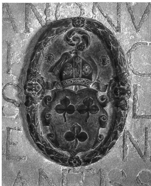
Fig. 117 Anonyme, Médaille en bronze de la pierre tombale de l'abbé Antoine Dupasquier mort en 1614, 32 x 23 cm (Chœur de l'église d'Hauterive). – Ornées d'un médaillon armorié, les dalles funéraires des abbés des XVII e et XVIII e siècles ont presque toutes été conservées, la plus belle étant celle d'Antoine Dupasquier.

L'ensemble impressionnant de tableaux, d'objets de piété, de souvenirs historiques, de meubles, de livres et d'archives, qui s'était constitué progressivement au fil des siècles et que Bernard-Emmanuel de Lenzbourg, en intellectuel éclairé, avait remis en valeur et enrichi à la fin du XVIII e siècle, allait être irrémédiablement dispersé à partir de 1848. En janvier, le nouveau pouvoir radical imposa une contribution de 400'000 fr. à l'abbaye et lui attribua un administrateur en la personne du syndic de Fribourg 34 . A la fin du mois de mars, la «riche communauté» d'Hauterive fut supprimée du jour au lendemain et ses biens réunis au domaine public. Dès la promulgation du décret, les religieux tentèrent de sauver des vases sacrés et des objets précieux. L'abbé Dosson le leur interdit. En juin, devant quitter définitivement le couvent, ils demandèrent à pouvoir emporter leur calice et leur chasuble. On le leur refusa. A ce propos, il faut rappeler que la même demande, présentée par les moines de Wettingen, avait été acceptée par le canton d'Argovie. Ce qui fait que toutes les pièces emmenées par les religieux se trouvent aujourd'hui à Mehrerau en Autriche, où ils se réfugièrent 35 .