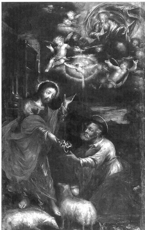
Fig. 111 Johann Achert, la Remise des clefs à saint Pierre, 1680, huile sur toile, 264 x 164 cm (Abbaye d'Hauterive). – Cette toile et le tableau ci-contre, de style très différent, mais pratiquement de même format et représentant tous deux la Sainte Trinité (patronne du maître-autel) et l'Eglise romaine, devaient faire pendants, probablement dans le chœur de l'église.

Considéré par le chroniqueur Castella comme «l'antiquaire le plus habile» de Suisse 5 et digne continuateur des mauristes 6 , Bernard-Emmanuel de Lenzbourg fut le premier semble-t-il à témoigner «d'un intérêt moderne» pour les sources médiévales d'Hauterive, et en particulier pour le Liber donationum, qu'il acheva de copier pour la première fois en 1748, à l'âge de 25 ans 7 . Par la suite, il devait classer toutes les archives de l'abbaye, constituant parallèlement des «collections diplomatiques», où il faisait recopier les actes qui lui semblaient les plus importants. Reliés en cuir, ces volumes ont été exécutés avec le plus grand soin. Les titres notamment ont été calligraphiés par le père Raphaël Castella, qui avait «un talent merveilleux pour écrire en lettres moulées par le moyen des caractères de cuivre jaune» 8 . Quant aux dessins commandés au père Meuwly 9 , reproduisant les sceaux appendus aux parchemins médiévaux 10 , ils pourraient bien être l'un des premiers témoins de sigillographie dans le canton. Poursuivant la tradition