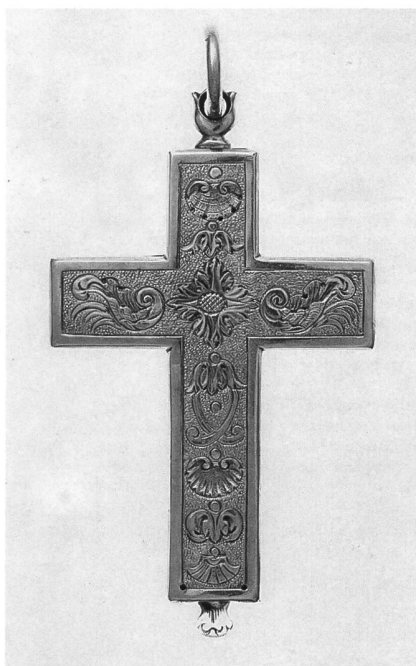
Fig. 126 Croix pectorale des abbés d'Hauterive, 2 e tiers du XVIII e siècle, or, 8,6 x 4,8 cm (Musée d'art et d'histoire de Fribourg, Inv. N° 4146).

49 La Sainte Famille, peinture, écran de cheminée? – Transférée d'Hauterive en 1876. – CAT. 1882, 23, N° 21. – Non identifiée. MAHF Inv. N°?