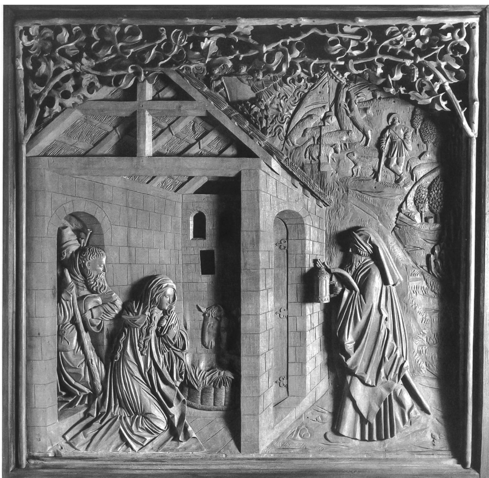
Fig. 110 Atelier de Hans Roditzer, l'Adoration des bergers, 1522, bois sculpté, 86 x 92 cm (Musée d'art et d'histoire de Fribourg, Inv. N° 3174.1, transféré d'Hauterive en 1873). – Cette Nativité (sans l'Enfant Jésus!), d'après une gravure de Dürer publiée en 1511, faisait partie du retable du maître-autel de 1522, enlevé en 1658 déjà.

ment enrichi le trésor de la sacristie (notamment d'un calice en or), et augmenté l'ensemble des ornements, en dépensant près de 500 écus. Enterré à Hauterive, son frère, le vicaire-général Dumont légua pour sa part une grande toile française du 2 e quart du XVII e siècle, qui est sans doute le meilleur tableau que l'on puisse rattacher à l'abbaye (fig.113). Défenseur sévère de la rigueur et de l'austérité, Candide de Fivaz n'a pourtant pas hésité à commander vers 1680 un très bel ensemble de tableaux, d'un style brillant et pathétique, à un jeune peintre nommé Johann Achert, de Rottweil, ville proche de l'abbaye cistercienne de Salem au bord du lac de Constance 3 (fig. 111).