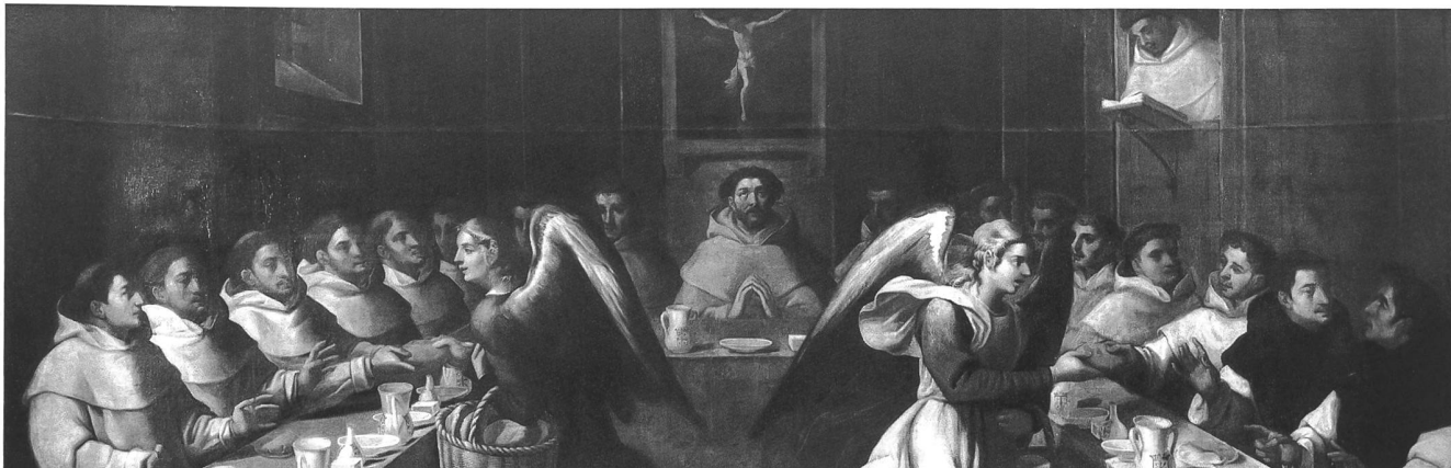
Fig. 115 Anonyme espagnol, le Miracle de saint Dominique entouré de ses religieux servis par des anges, 2 e quart du XVII e siècle, huile sur toile, 140 x 430 cm (Musée d'art et d'histoire de Fribourg, en dépôt à la Maison St-Hyacinthe à Fribourg). – Représentant soi-disant des «religieux bernardins», comme on le croyait au XIX e siècle, ce tableau coupé en haut et en bas se trouvait dans le réfectoire d'Hauterive. Donné semble-t-il par le comte de Pourtalès, établi à Greng dès 1815, il a été revendu par l'Etat à son ancien propriétaire en 1856, avant que ses héritiers n'en fasse don au Musée en 1882.

une montre et une tabatière, il fit venir en 1775-1776 des «Tapisseries de papier pour les appartements neufs» 25 . Dans ces années-là, la mode des papiers peints parisiens commençait juste à se répandre dans le canton, et l'abbé de Lenzbourg dut être parmi les premiers à l'adopter. Conservé au château de Mézières, un échantillon intéressant de papiers peints des années 1770 permet d'imaginer un tant soit peu l'aspect de l'abbatiale avec un beau décor Louis XVI 26 .