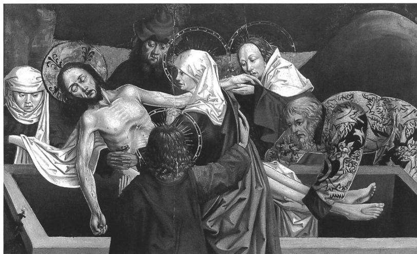
Fig. 112 Anonyme, la Mise au tombeau, vers 1480, détrempe sur bois, 68 x 83,5 cm (Musée d'art et d'histoire de Fribourg, Inv. N° 7976, transféré d'Hauterive en 1873). – La destination exacte de cette peinture double face, dont le dos représente un roi amorrite fuyant sous une grêle de pierres, n'a pu être précisée pour le moment.