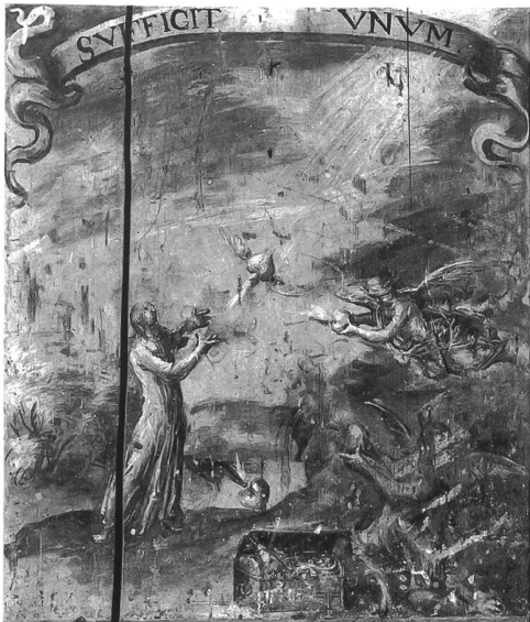
Fig. 119 Anonyme, Allégorie de l'amour divin ?, fin du XVII e siècle, peinture en camaïeu sur bois, 53 x 46,5 cm (Abbaye d'Hauterive). – Copiant sans doute une feuille d'« emblemata », ce panneau peint moralisant décore la porte, aujourd'hui isolée, d'une ancienne armoire de cellule.

1276 à 1836, formant de très loin le groupe le plus nombreux de ce type. Dans ces archives, «aussi remarquables par leur richesse que par leur bonne conservation» 38 , on déplore cependant quelques lacunes, antérieures au transfert il faut le dire. Ainsi, le fameux Liber donationum , conservé en Angleterre depuis 1824 au moins, a été finalement donné à la Bibliothèque royale de Prusse à Berlin peu après 1912 39 .